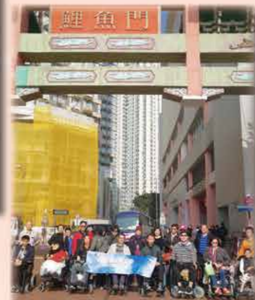
新界西 - 漫遊鯉魚門