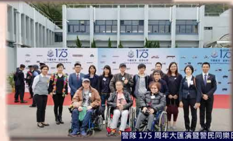
警隊 175 周年大匯演暨警民同樂日