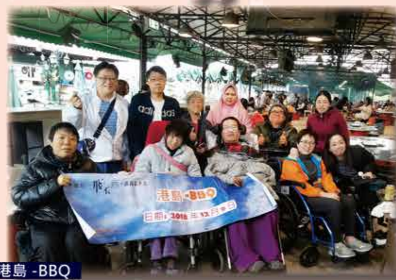
港島 - BBQ