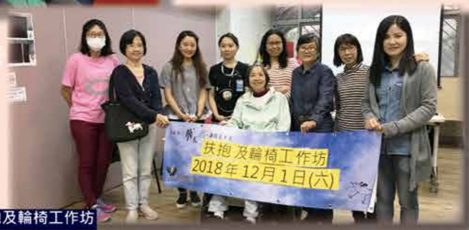
扶抱及輪椅工作坊