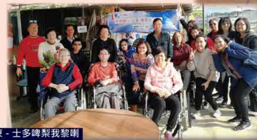
新界東 - 士多啤梨我黎喇