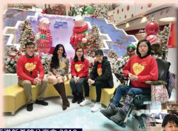
香港新希望分享會 2019