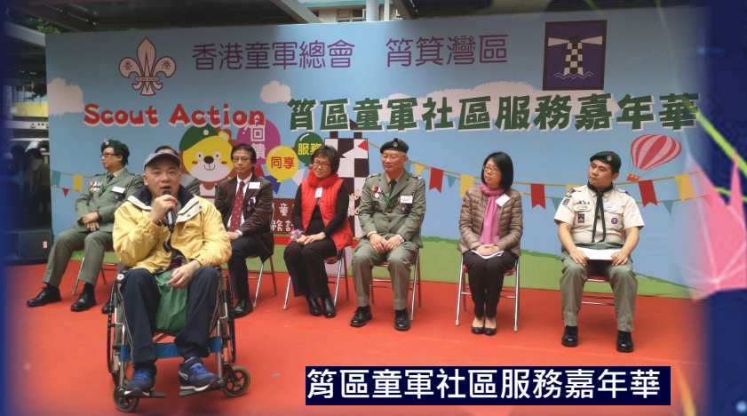
筲區童軍社區服務嘉年華