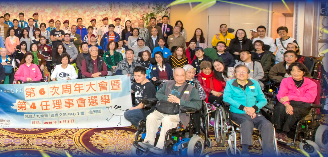
第6次周年大會暨 第4任理事會選舉