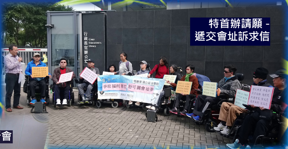
特首辦請願 - 遞交會址訴求信