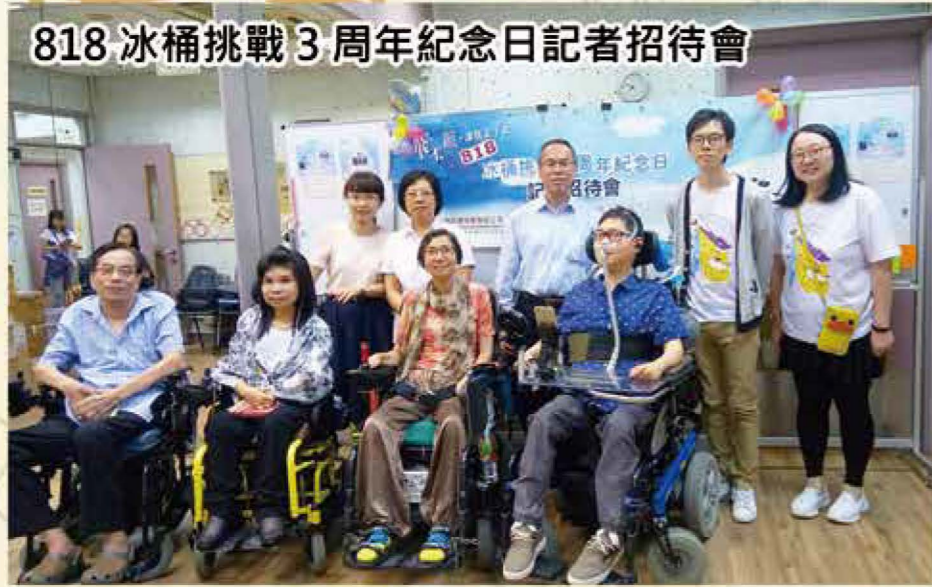
818 冰桶挑戰 3 周年紀念日記者招待會