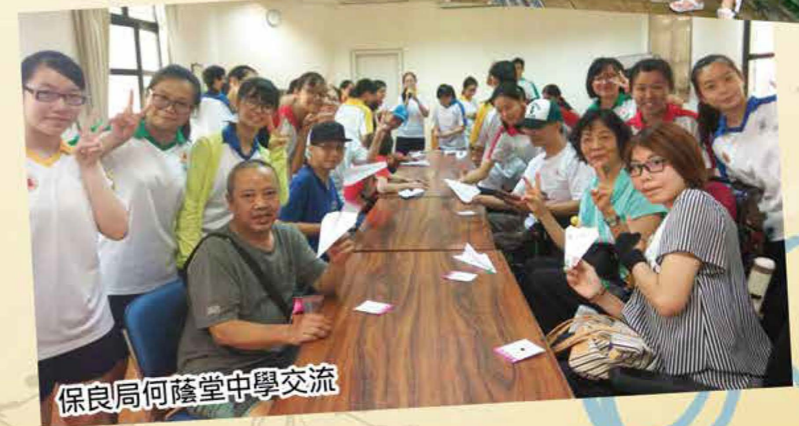
保良局何蔭堂中學交流