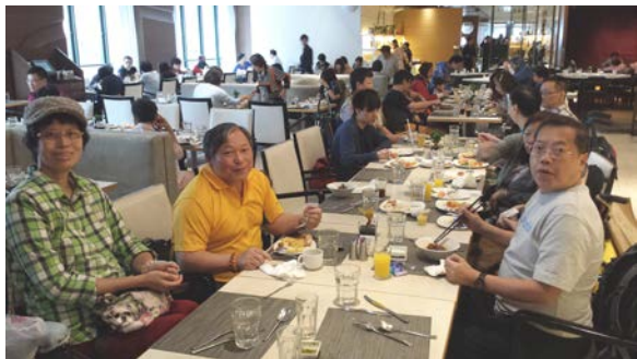
九龍東 - 開心自助餐