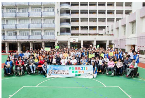
步出生肌 329 步行籌款