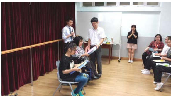
佛教大光慈航中學交流