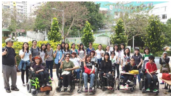
九龍中 - 赤柱遊縱