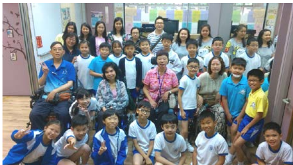
九龍塘宣道小學交流