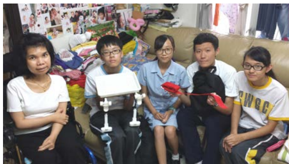
大圍宣道會鄭榮之中學交流