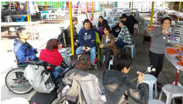
新界東小欖燒烤樂