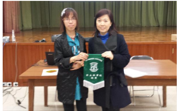
高主教書院到校交流