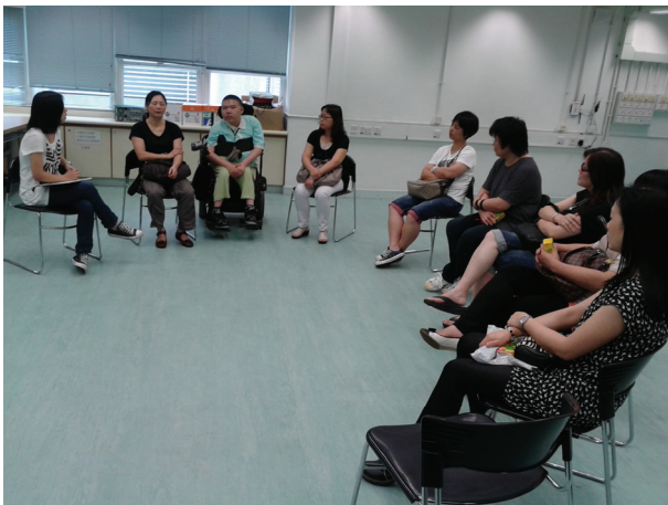
F20120613 到校交流(培愛學校)