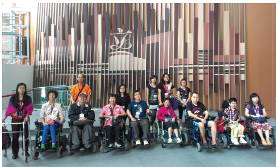
F20120825 參觀香港立法會綜合大樓