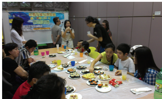
F20120826 家長組 HAPPY SHARE