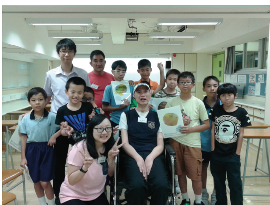
F20120613 則仁中心到校交流